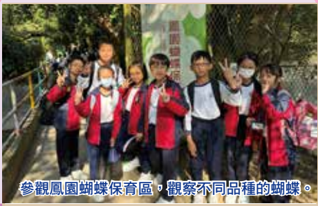
參觀鳳園蝴蝶保育區，觀察不同品種的蝴蝶。