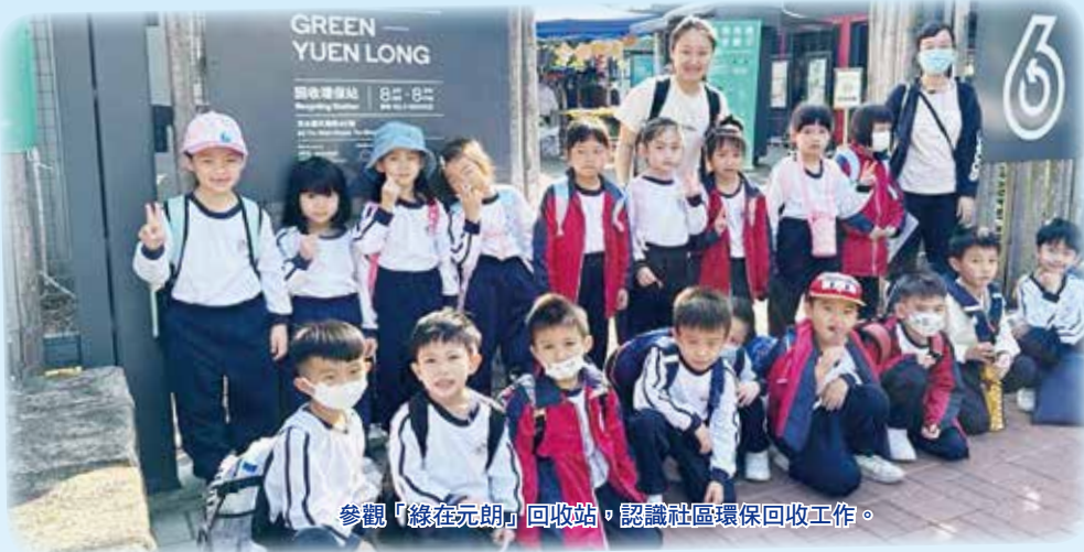
參觀「緣在元朗」回收站，認識社區環保回收工作。