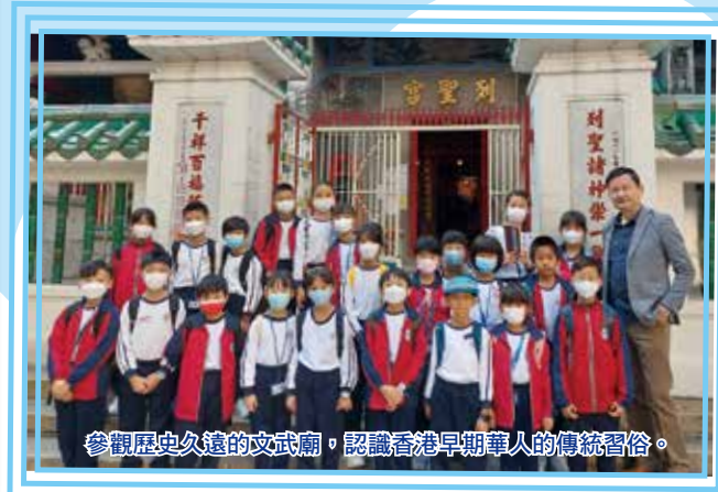
參觀歷史久遠的文武廟，認識香港早期華人的傳統習俗。