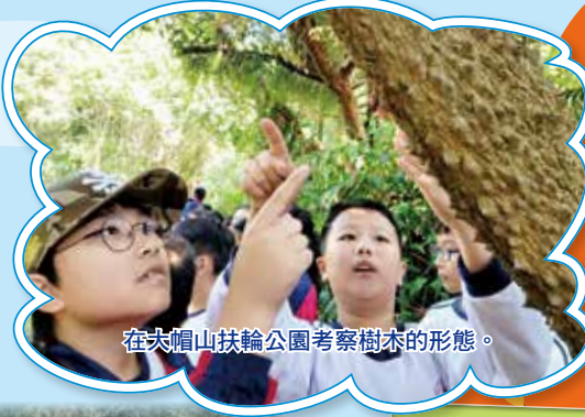
在大帽山扶輪公園考察樹木的形態。