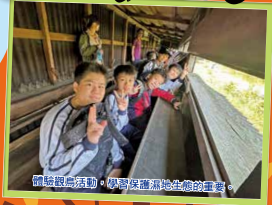
體驗觀鳥活動，學習保護濕地生態的重要。