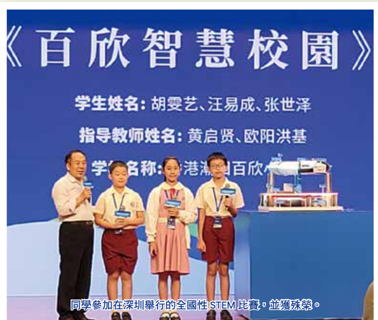
同學參加在深圳舉行的全國性 STEM 比賽，並獲殊榮。