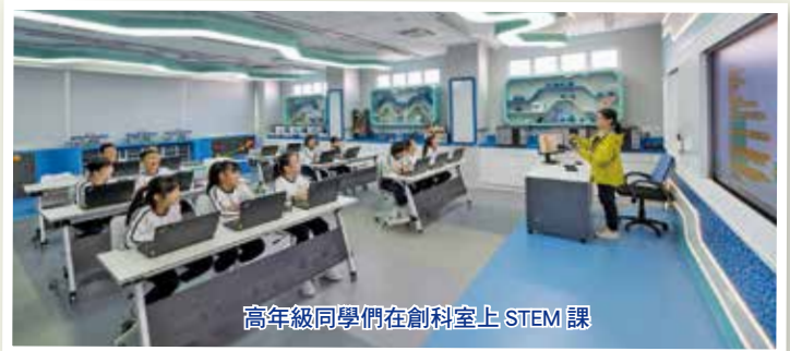
高年級同學們在創科室上 STEM 課

學校運用優質教育基金的資助及「百欣十五周年校慶優化校舍設備計劃」捐款，把校舍七樓增建的兩個特別教室化身為「百欣創新天地」——「演藝室」(Theater) 和「創科室」(STEM Lab)。創科室及位於二樓的電腦室設備齊全，是學生學習 STEM 課程的好地方。