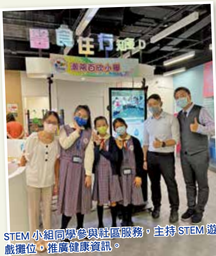
STEM 小組同學參與社區服務，主持 STEM 遊戲攤位，推廣健康資訊。