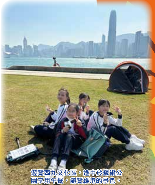
遊覽西九文化區，途中於藝術公園享用午餐，飽覽維港的景色。