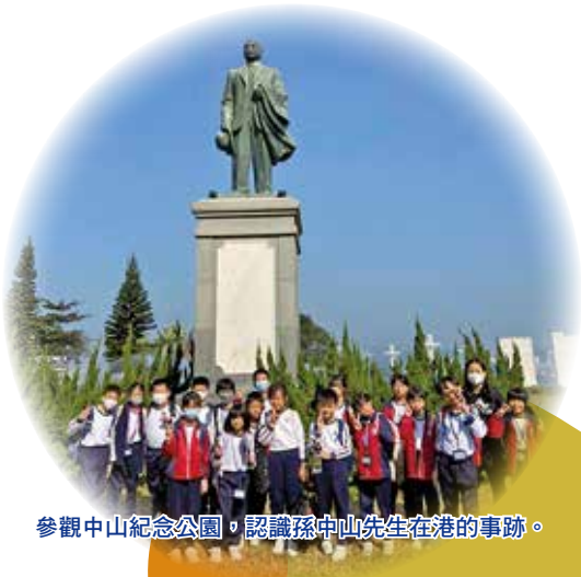
參觀中山紀念公園，認識孫中山先生在港的事跡。