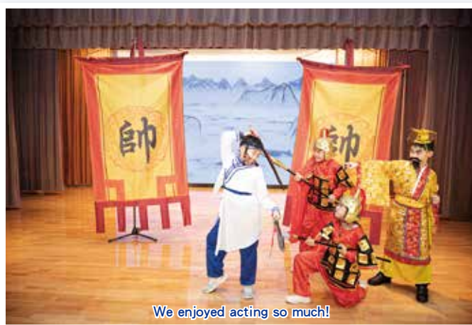
We enjoyed acting so much!