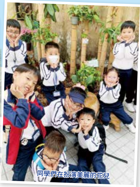
同學們在扮演美麗的花兒