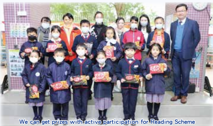
We can get prizes with active participation for Reading Scheme

As CYPY students, they can blast off into a universe of reading with an all-in-one eBook platform anytime. It delivers hundreds of interactive, leveled eBooks. By reading and listening to stories, students can earn stars through various activities and purchase fun items to create and customize their own Rocket. Hope everyone has a fun ride with his wonderful Rocket!