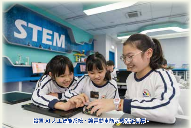
設置 AI 人工智能系統，讓電動車能完成指定目標。