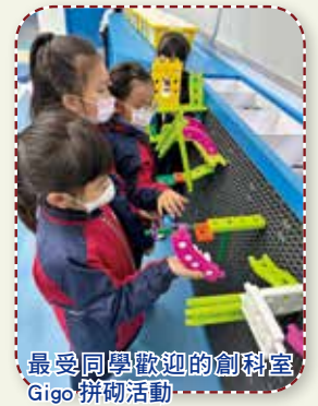
最受同學歡迎的創科室 Gigo 拼砌活動