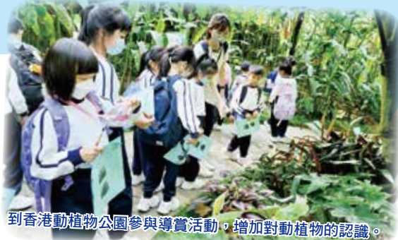
到香港動植物公園參與導賞活動，增加對動植物的認識。