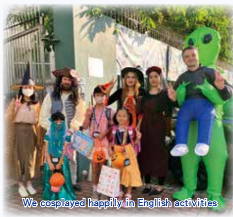
We cosplayed happily in English activities