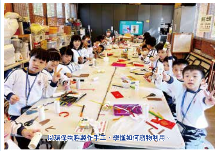
以環保物料製作手工，學懂如何廢物利用。