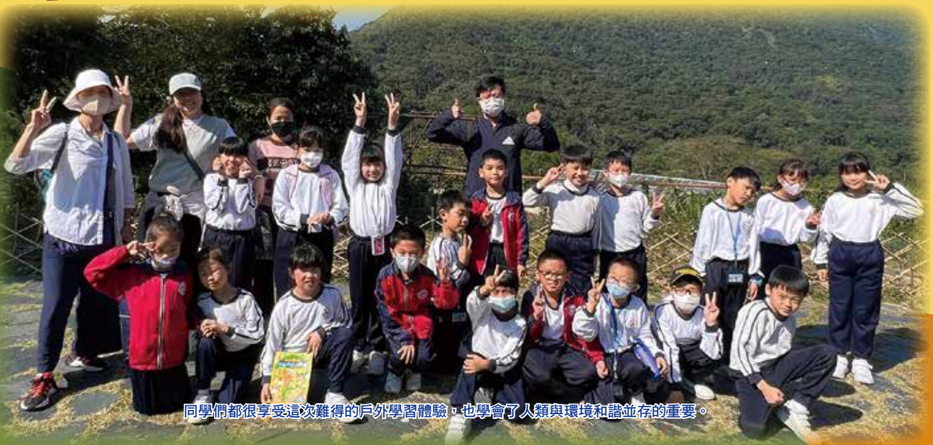
同學們都很享受這次難得的戶外學習體驗，也學會了人類與環境和諧並存的重要。