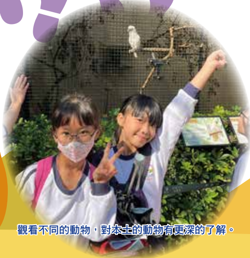
觀看不同的動物，對本土的動物有更深入的了解。