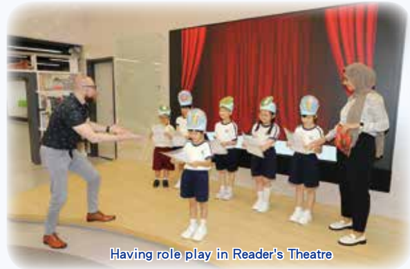
Having role play in Reader's Theatre

It is a synthetic phonics-based programme which helps children learn to read whilst also develop a wide range of vocabulary and encourage a love of stories. Students love to practice sounds, high frequency words and blending with fun and speed games with Fred Frog, a fun character in RWI programme.