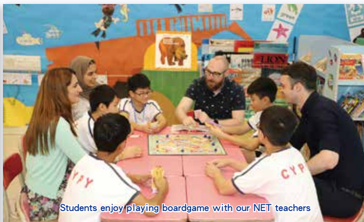
Students enjoy playing boardgame with our NET teachers