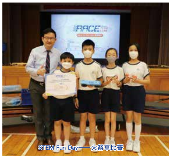
STEM Fun Day——火箭車比賽