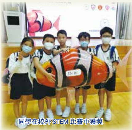
同學在校外 STEM 比賽中獲獎

學校設有 STEM 小組為有潛質同學提供拔尖培訓，同學有機會參加校外活動及比賽，並獲得殊榮。另外，STEM 小組的同學也參與社區服務。他們為博愛醫院推廣健康資訊及為「VR Tour」平台拍攝介紹中心設備短片，讓地區人士認識中心及其服務。