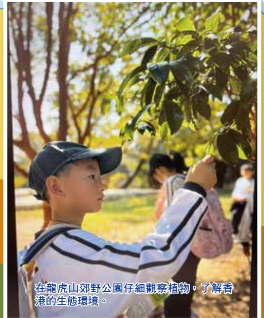
在龍虎山郊野公園仔細觀察植物，了解香港的生態環境。