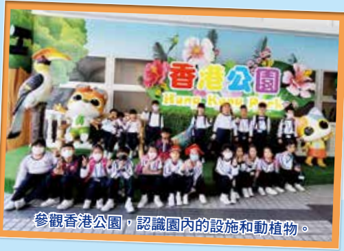
參觀香港公園，認識園內的設施和動植物。