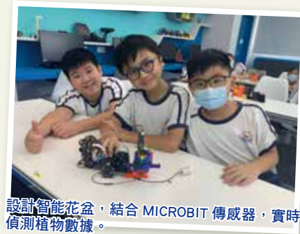
設計智能花盆，結合 MICROBIT 傳感器，實時偵測植物數據。