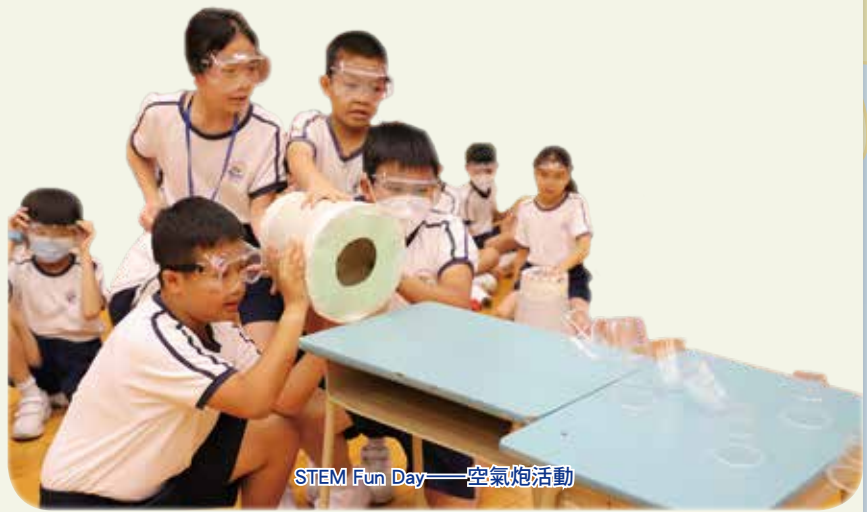
STEM Fun Day——空氣炮活動