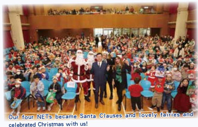
Our four NETs became Santa Clauses and lovely fairies and celebrated Christmas with us!