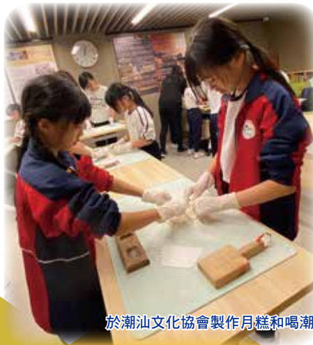
於潮汕文化協會製作月餅和喝潮州功夫茶，體驗潮汕文化。