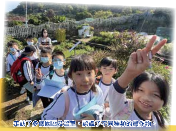
走訪了多個園區及溫室，認識了不同種類的農作物。