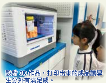
設計 3D 作品，打印出來的成品讓學生分外有滿足感。