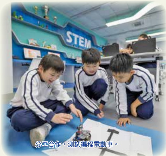
分工合作，測試編程電動車。

學校一至六年級均有 STEM 課堂，同學會學習到電腦繪圖課程、編程以及創客課程等。課程多元化，提升學生運用資訊科技學習的能力，培養科探精神及創意解難能力。