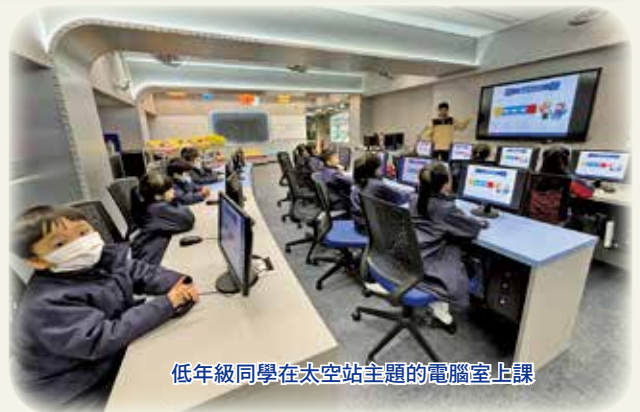
低年級同學在太空站主題的電腦室上課