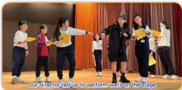
Our director led us to perform well on the stage

Students unleash creativity on stage with dramatic performances, building confidence and effective communication skills.