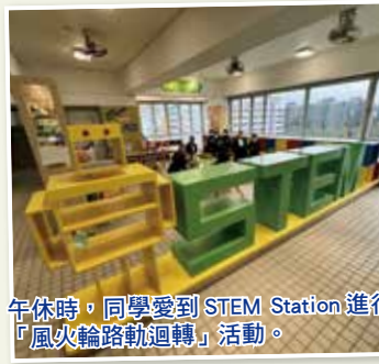
午休時，同學愛到 STEM Station 進行「風火輪路動迴轉」活動。

學校在午間活動時段開放創科室，讓學生使用 Gigo 模型及積木牆；另外，亦開放六樓的 STEM Station，讓學生進行 STEM 活動。另外，學校每年舉辦大型的 STEM Fun Day 活動，讓每個同學都有更多機會體驗 STEM 活動的樂趣。