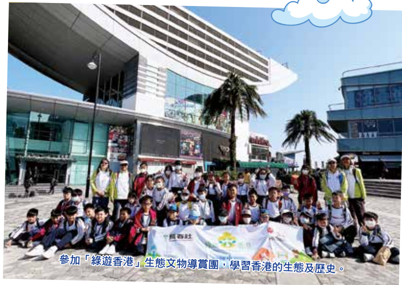
參加「綠遊香港」生態文物導賞團，學習香港的生態及歷史。