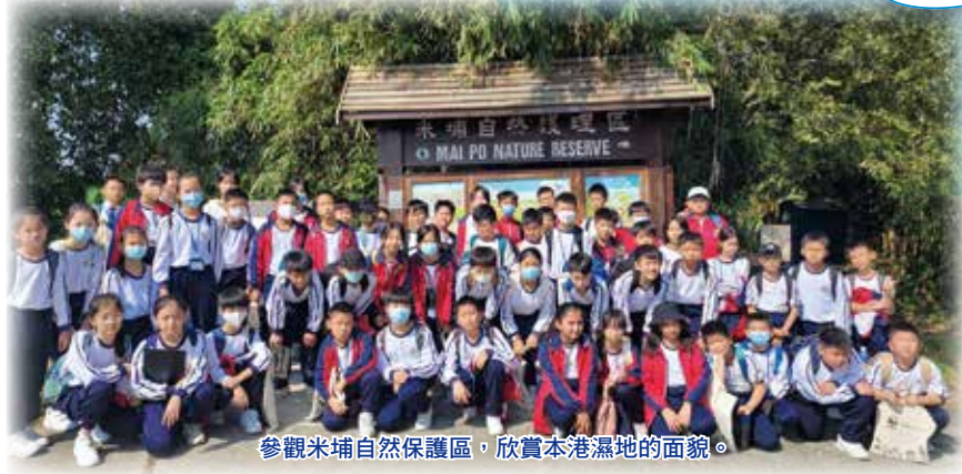
參觀米埔自然保護區，欣賞本港濕地的面貌。