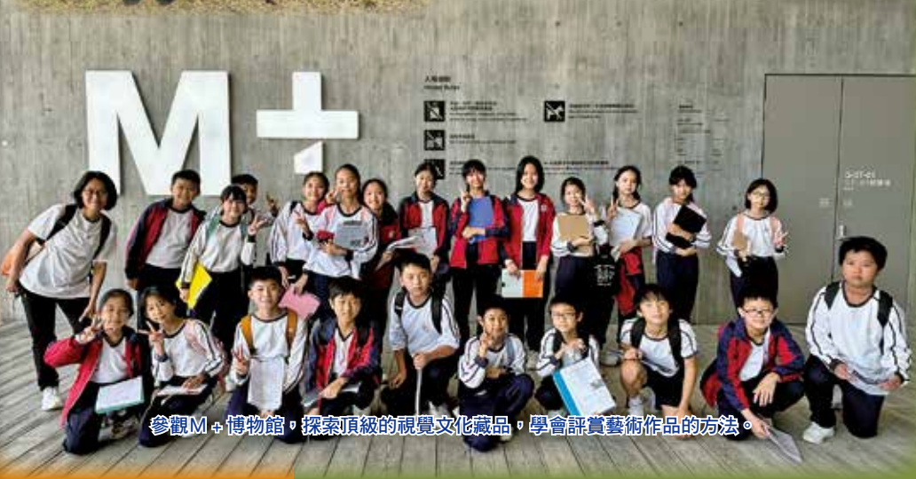
參觀M+博物館，探索頂級的視覺文化藏品，學會評賞藝術作品的方法。