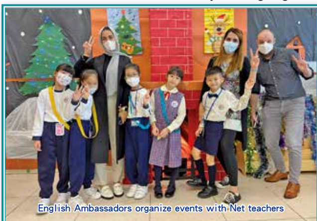
English Ambassadors organize events with Net teachers

The English Ambassadors inspire a love for language leadership, as they organize events and activities to foster a community of language lovers.