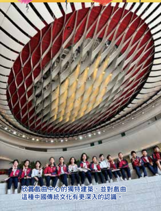
欣賞戲曲中心的獨特建築，並對戲曲這種中國傳統文化有更深入的認識。