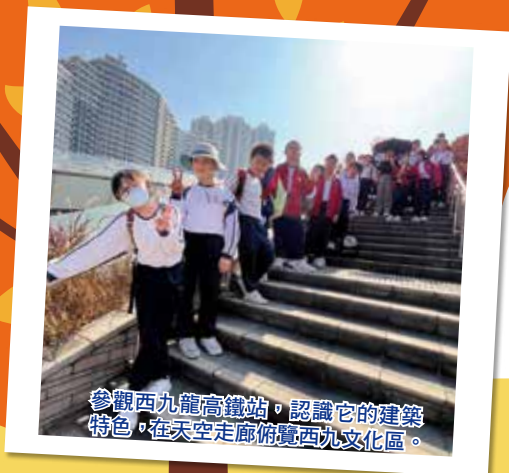
參觀西九龍高鐵站，認識它的建築特色，在天空走廊俯覽西九文化區。