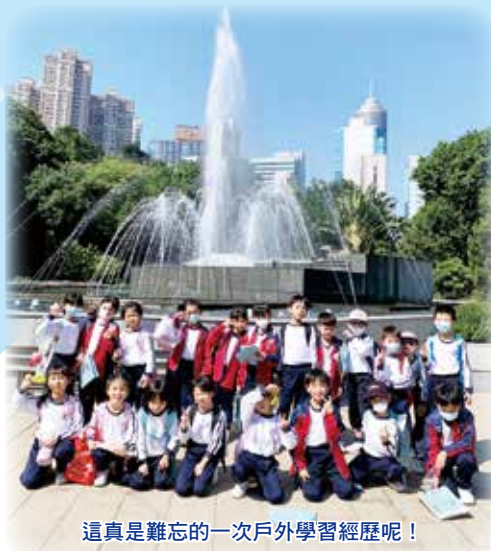
這真是難忘的一次戶外學習經歷呢！