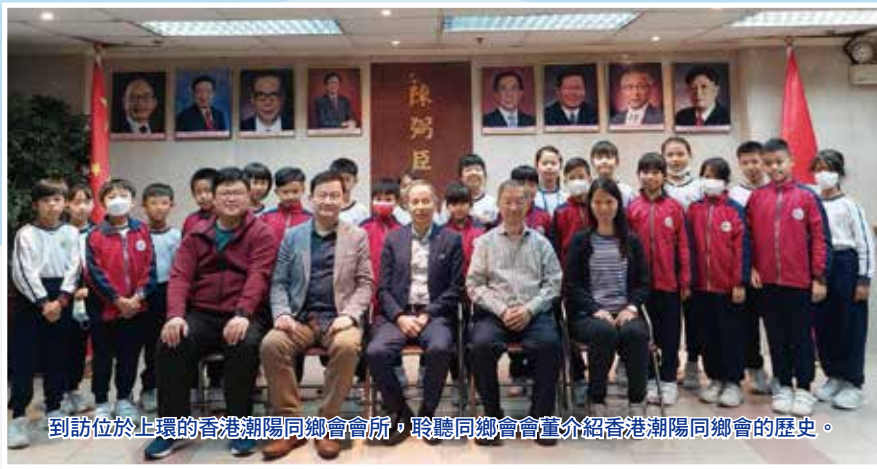
到訪位於上環的香港潮陽同鄉會會所，聆聽同鄉會會董介紹香港潮陽同鄉會的歷史。