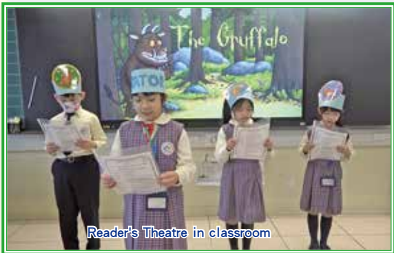
Reader's Theatre in classroom