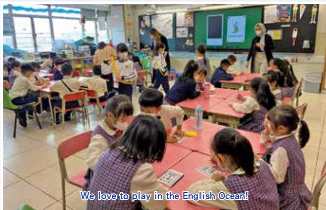
We love to play in the English Ocean!

Our English room is ocean themed. Various English fun games and activities including Bookworms' Club, Spelling Bee, storytelling, fun board games and festive fun games are held weekly. You can meet our four NETs there who will help you dive for gold coins and treasures!