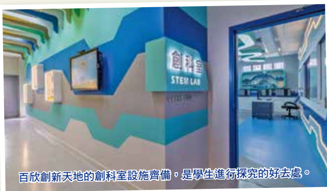
百欣創新天地的創科室設施齊備，是學生進行探究的好去處。